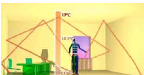
Temperatura interna con GP SunZenit Nanotech interior